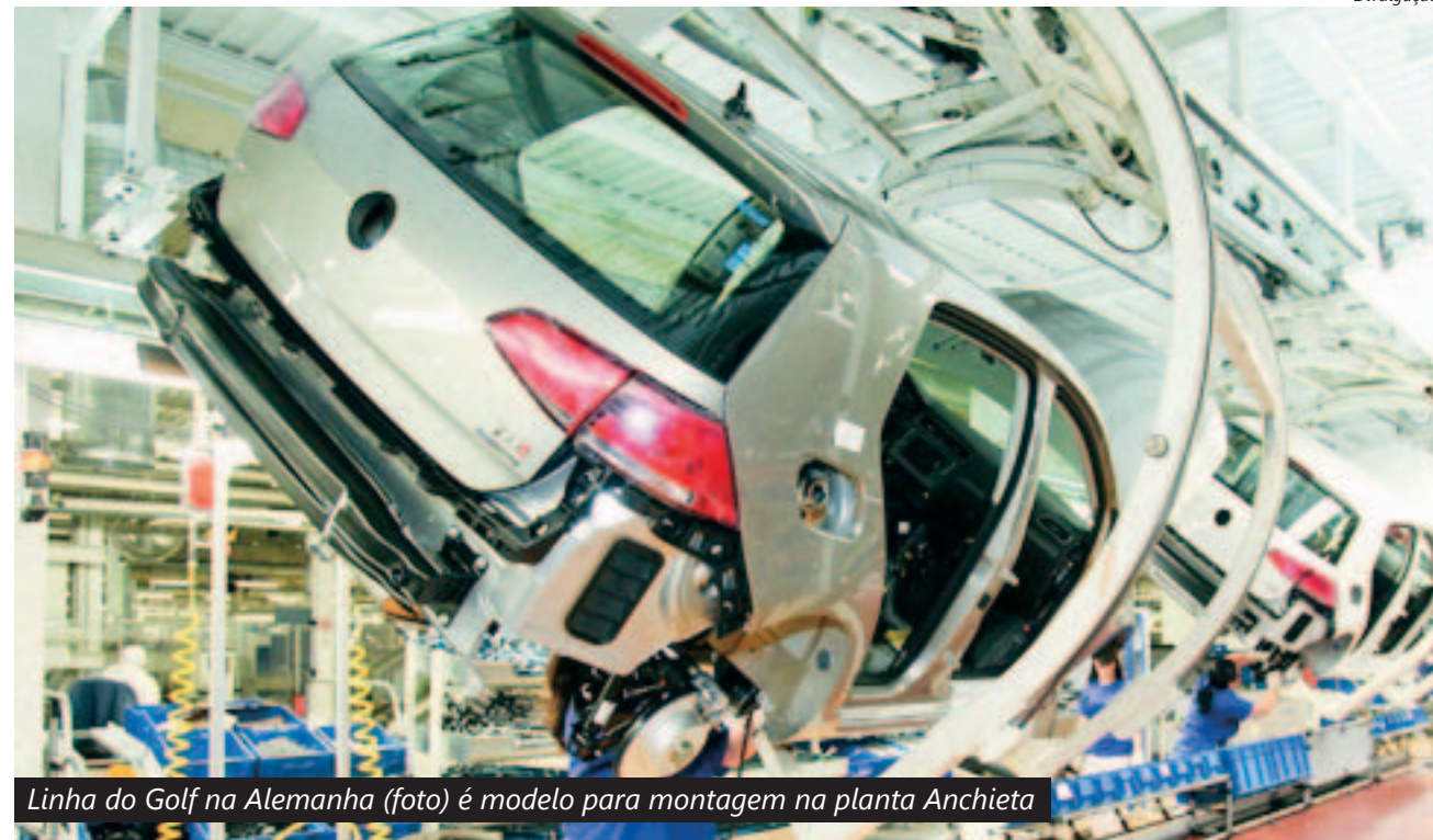
Linha do Golf na Alemanha (foto) é modelo para montagem na planta Anchieta

Os 2.200 trabalhadores na área receberam treinamento in-